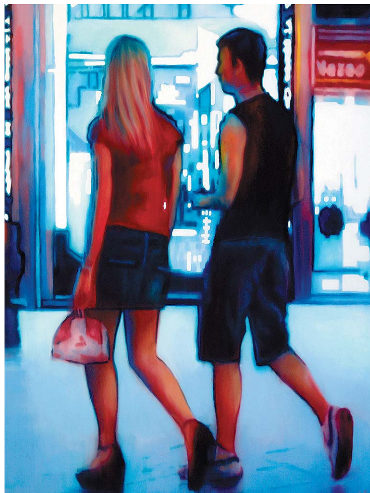
Uno de los óleos integrados en la muestra 'Urban Glimpse'.