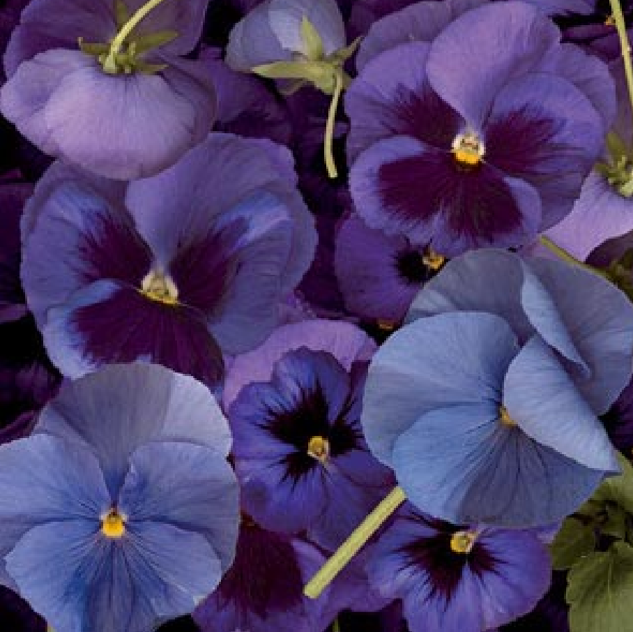
Pensamientos. A Emily Dickinson. 2005 Fotografía. 125 x 125 cm. Edición de 5