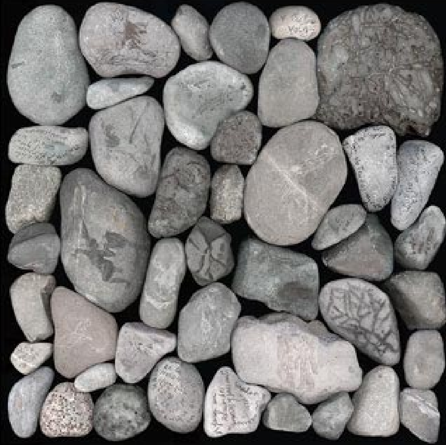
Cantos rodados, de los sueños. A Carl Jung. 2004 Fotografía. 125 x 125 cm. Silicona, metacrilato, aluminio Edición de 7