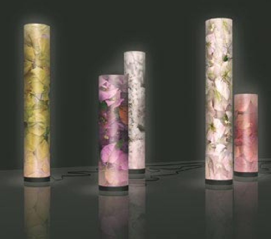
Jardín de la melancolía. Al hombre cansado de la vida. 2004-2006 Tubos metacrilato, fotografía, luz