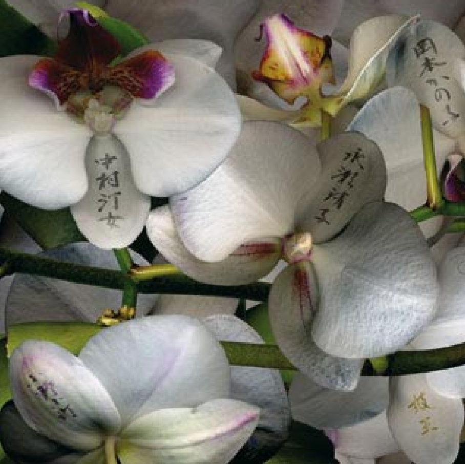
Orquídea. A Ono No Komachi, Okamoto Kanoko. 2007 Fotografía. 60 x 60 cm. Edición de 7