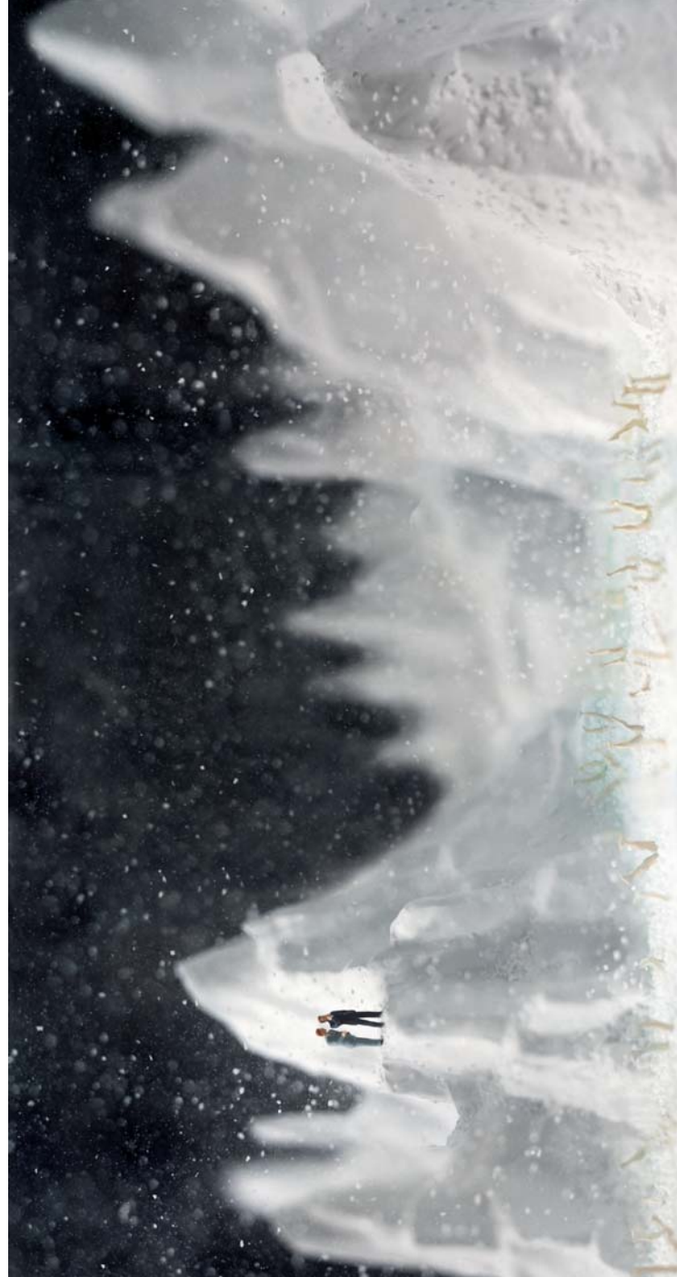
"The Great Frozen Lake" Edición de 6. C-Print, montada en plexi, abrazaderas de aluminio. 2005. 89 x 170 cm.