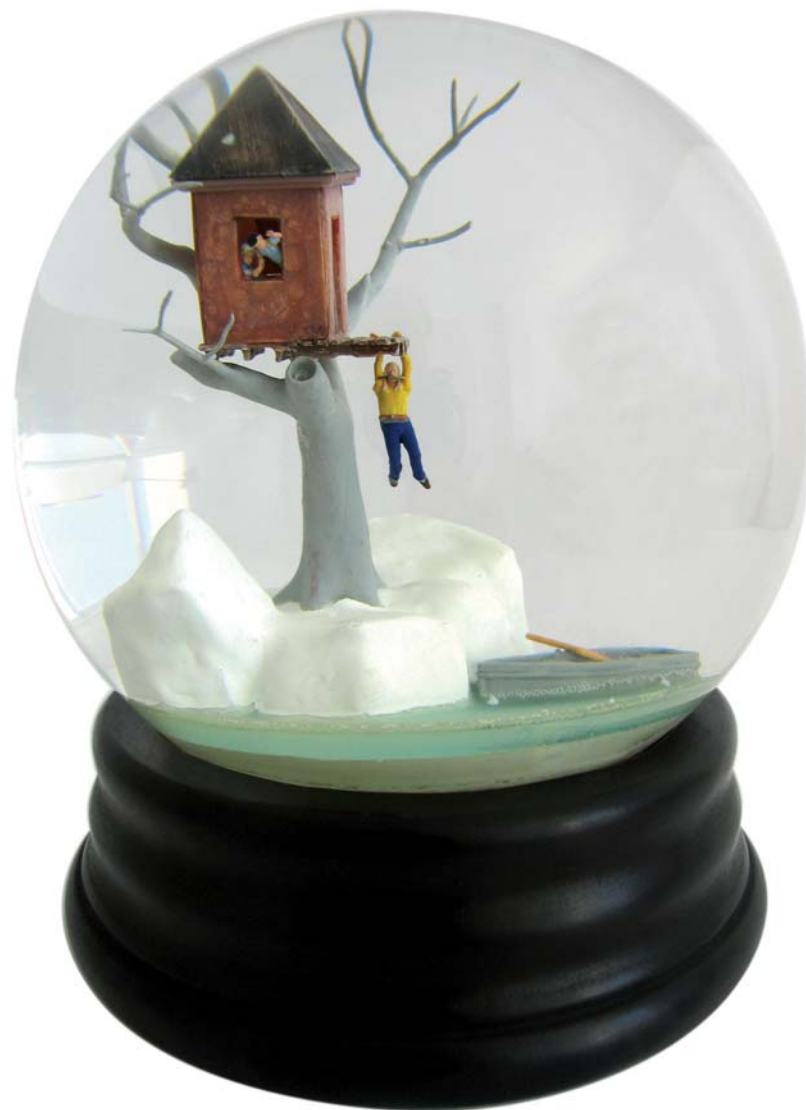
“Traveler 103” Detalle Objeto. 2004. 23 x 15 x 15 cm.

El juego con la apariencia es aquí fundamental. Vivimos un mundo donde la imagen edulcorada ha desbancado la solvencia representativa del referente primero que ha servido de pretexto a la imagen en sí. Todo (o mucho) se reduce a la apariencia exterior donde la fuerza del travestismo y la instalación del simulacro gozan de un altísimo rendimiento. Estas piezas juegan a un uso retórico y engañoso del objeto, estimulando una distancia en extremo efectiva que es justo la que garantiza su éxito. A simple vista, lo decía antes de algún modo, estas obras parecen una cosa, confunden desde la evidencia; sin embargo, la proximidad y