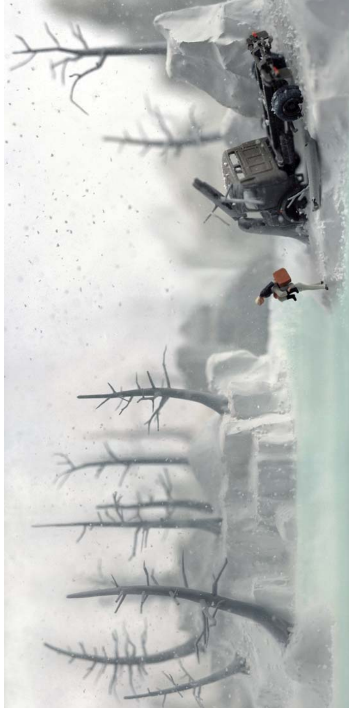
“Crossing the Watery Glass” Edición de 6. C-Print, montada en plexi, abrazaderas de aluminio. 2005. 89 x 170 cm.

El arte que sobrevive al paso del tiempo quizá es aquel que dialoga con distintas tradiciones y éste en buena medida lo hace, así la potencia reflexiva de esta muestra, de esta obra, va fuertemente de la mano de su sabor estético. No diremos más. Sólo que de la explosiva experiencia del aislamiento en el enrarecido ambiente navideño con nieve, y agravado por la presencia diaria de la pareja,