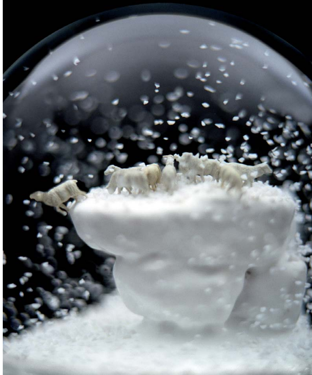
"Traveler 88 at Night"

The connection with the artistic tradition of German romanticism is not a coincidence - that which starts on this path and leads to the abyss of men against nature - the infinite horizons as representation of a surrounding void, the cliffs inviting the fall, knotty forests - the smallness against the outside, that in the paintings of Caspar David Fiedrich is expressed with more force and nudity, as in the case of the splendid Monk by the sea , whose vastness transmutes in an omnipresent void, or The abbey in the oak grove where gloomy trees and their shadowy chapel lay a bridge towards the origins of the medieval gothic.