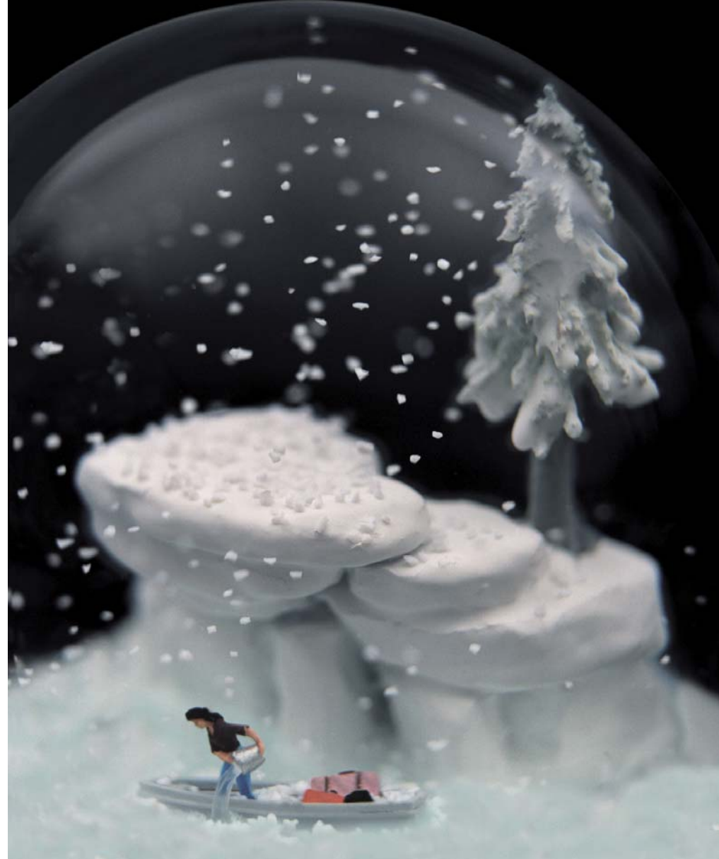
"Traveler 94 at night"

El recurso al gótico por parte de la pareja de artistas, posee otra arista que nos aporta una clave definitiva para la interpretación de esa especie de rol de medium epocal que parecen encarnar. Han revelado en entrevistas su inspiración y amor por el arte flamenco, por la vitalidad de sus coloridos, por los grabados simbólicos del siglo XV –concretamente las obras de Bruegel y Joachim Patinir–, que además de impulsar algunos de sus trabajos como The Nursery o A Winter Walk , sirven